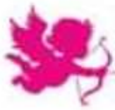
Planche en amoureux